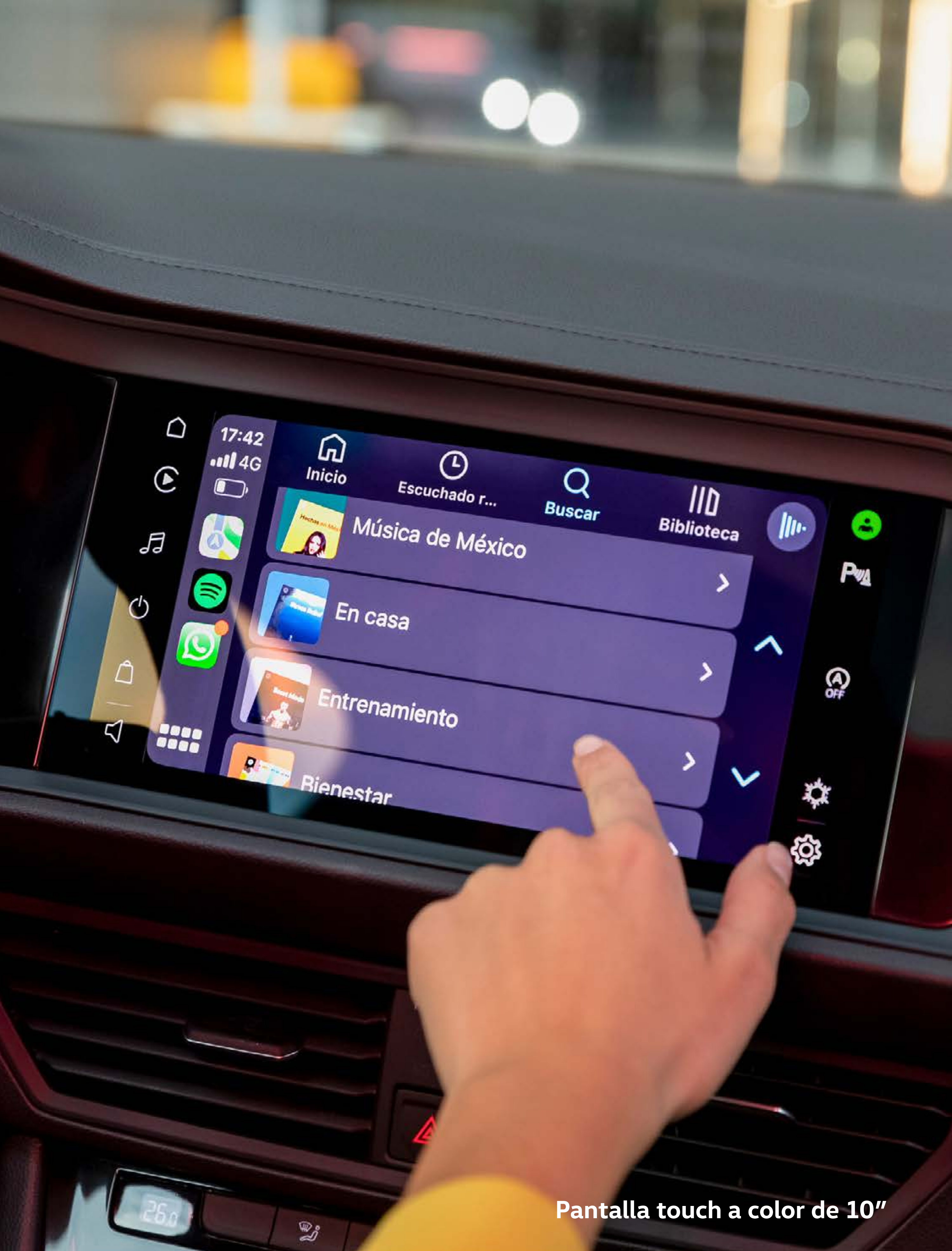
Pantalla touch a color de 10"