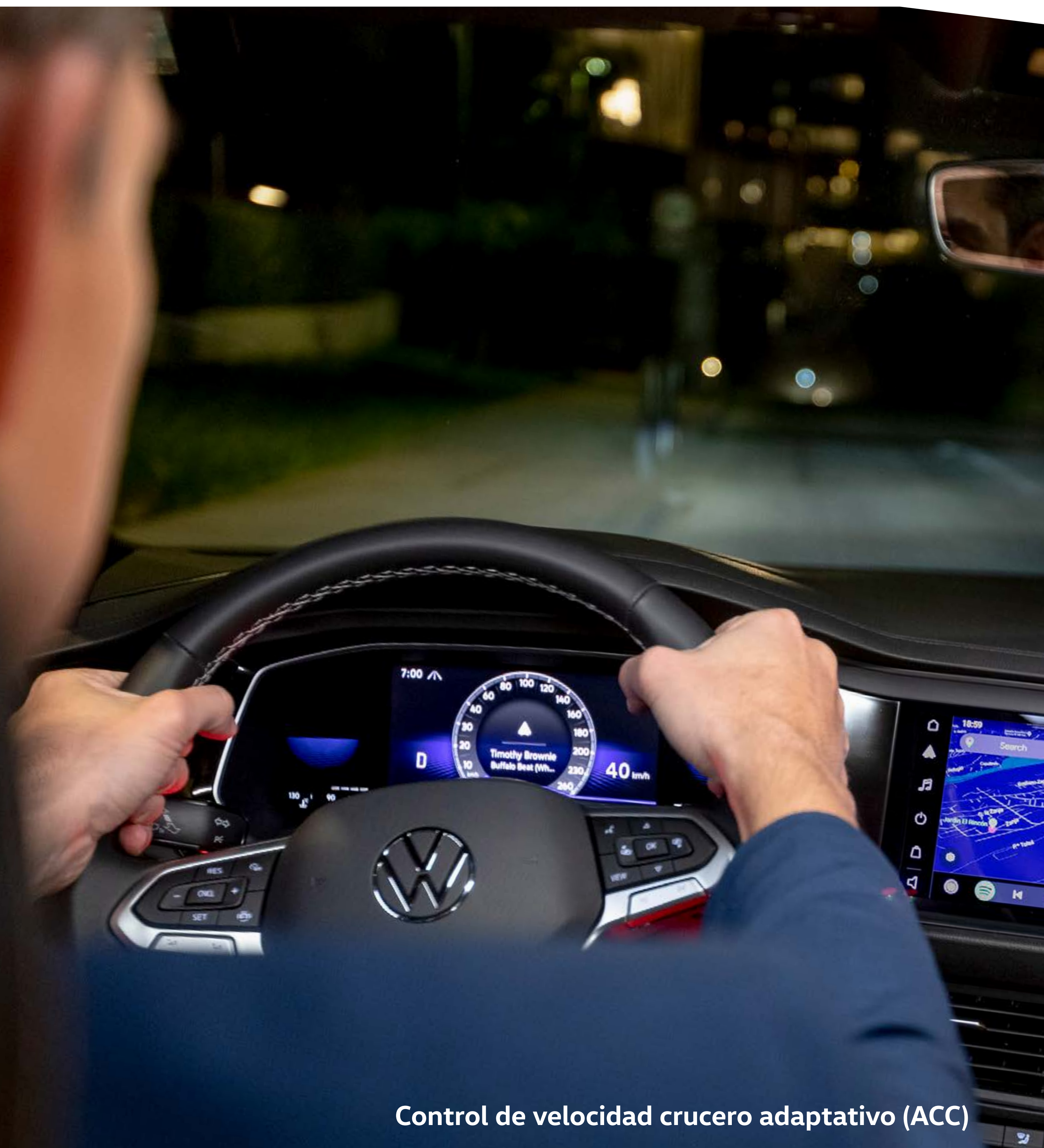
Control de velocidad crucero adaptativo (ACC)

Se acabaron las frases de fastidio en viajes largos. El control de velocidad crucero adaptativo (ACC) regula la aceleración de forma electrónica, así ahorras combustible y a la vez mantienes una distancia segura con otros conductores. SL