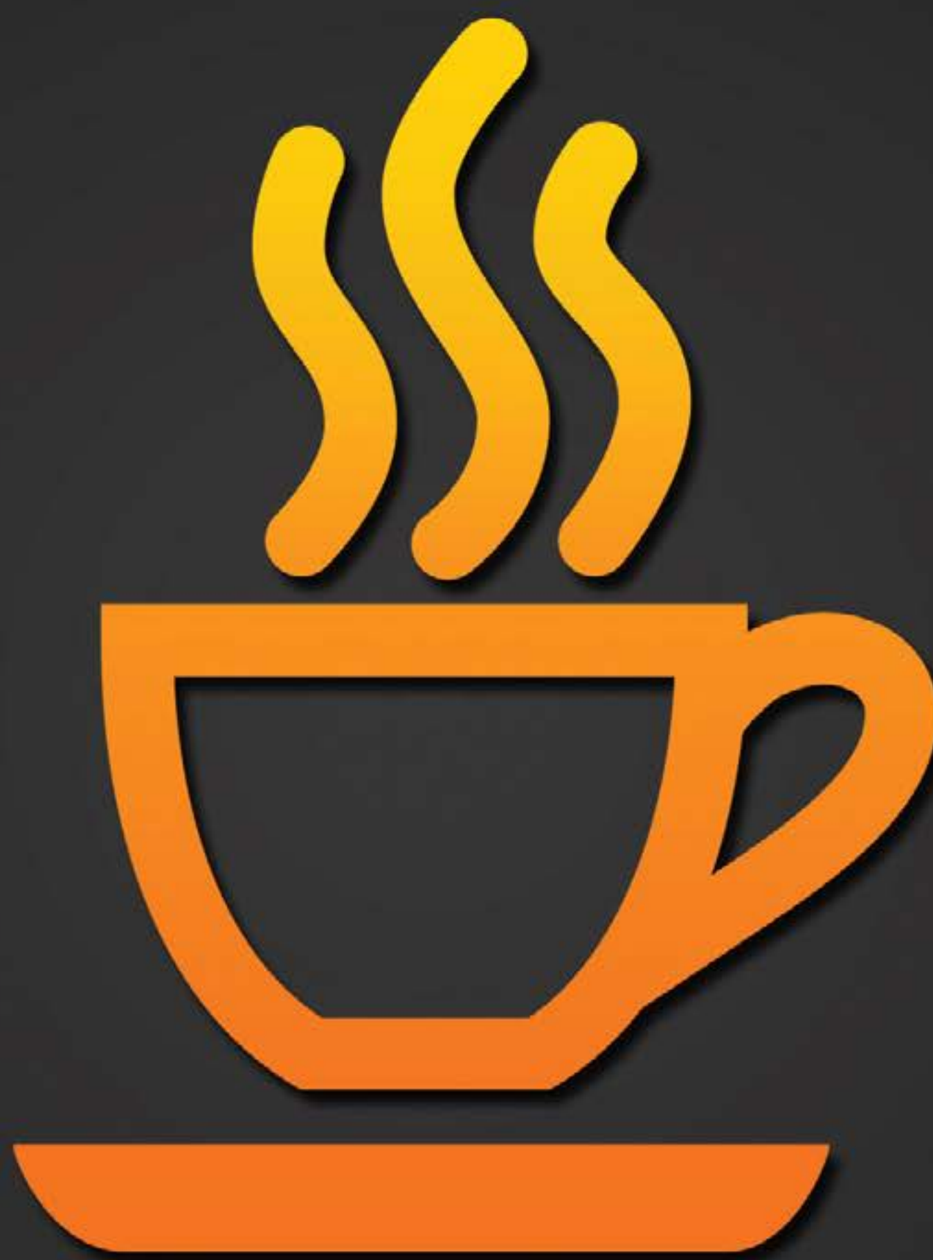
Detector de cansancio

Mientras manejamos, a veces cabeceamos por el sueño sin darnos cuenta. No te preocupes, Jetta 2024 te cuida con el detector de cansancio que analiza la dirección, el pedal y el tiempo continuo de manejo; si nota que tu concentración disminuye, emite una advertencia visual y otra acústica. CL SL