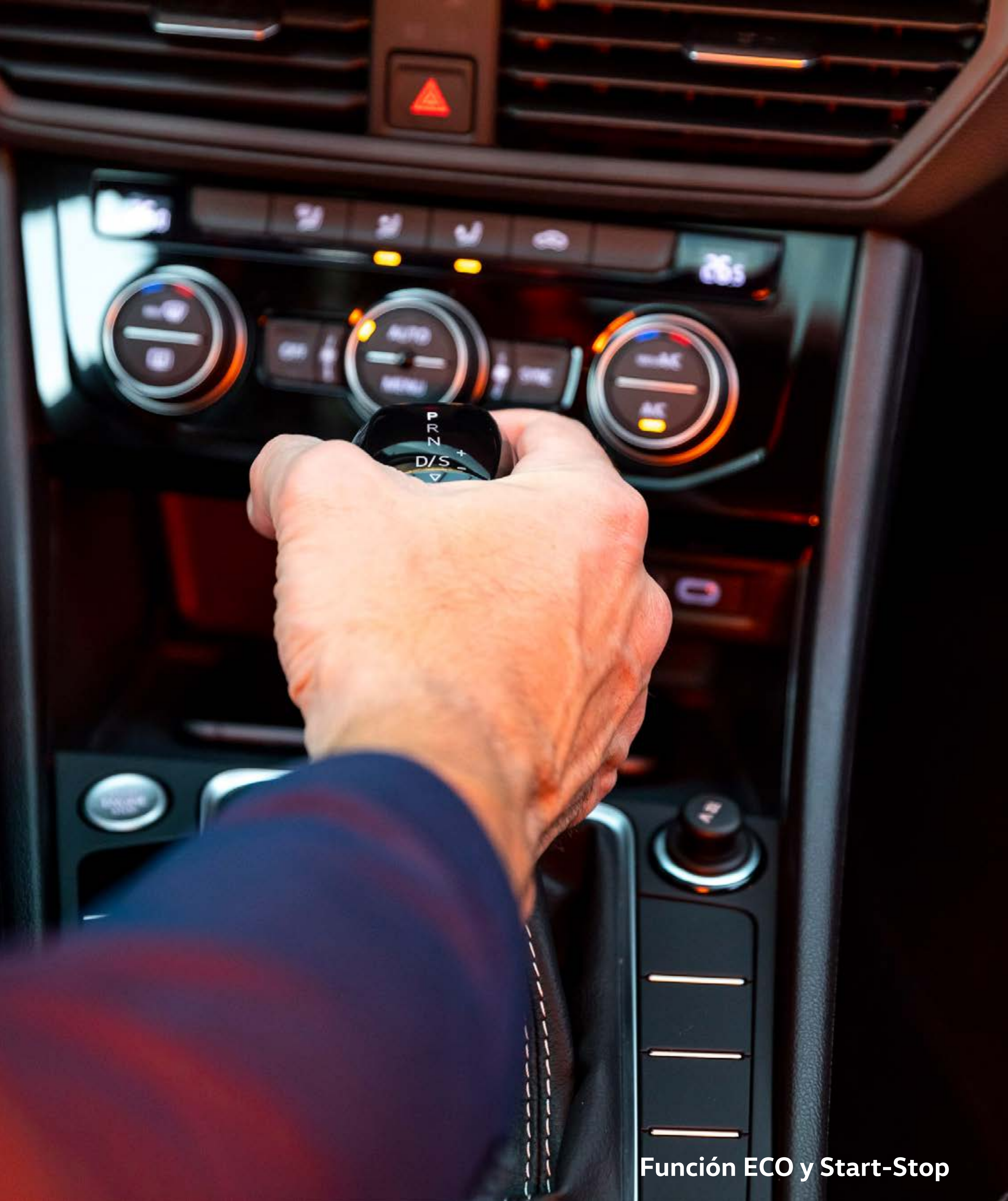
Función ECO y Start-Stop