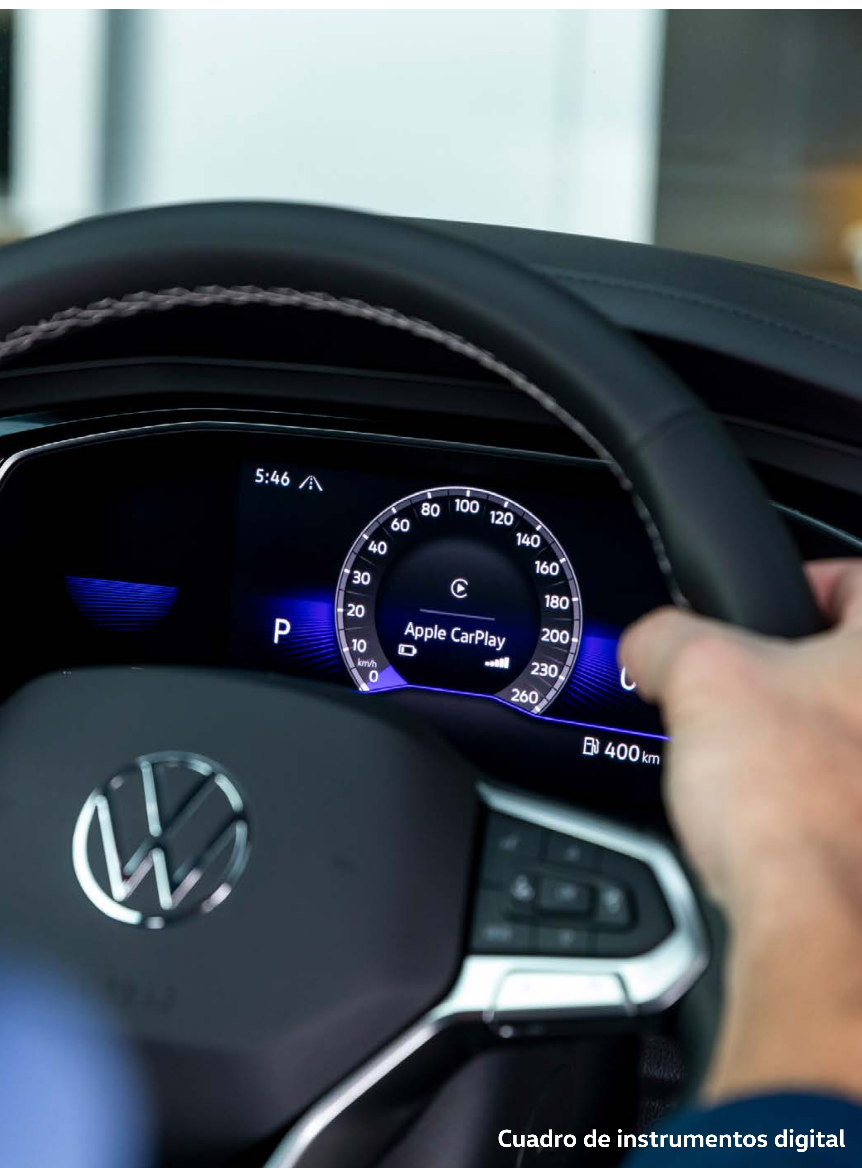
Cuadro de instrumentos digital