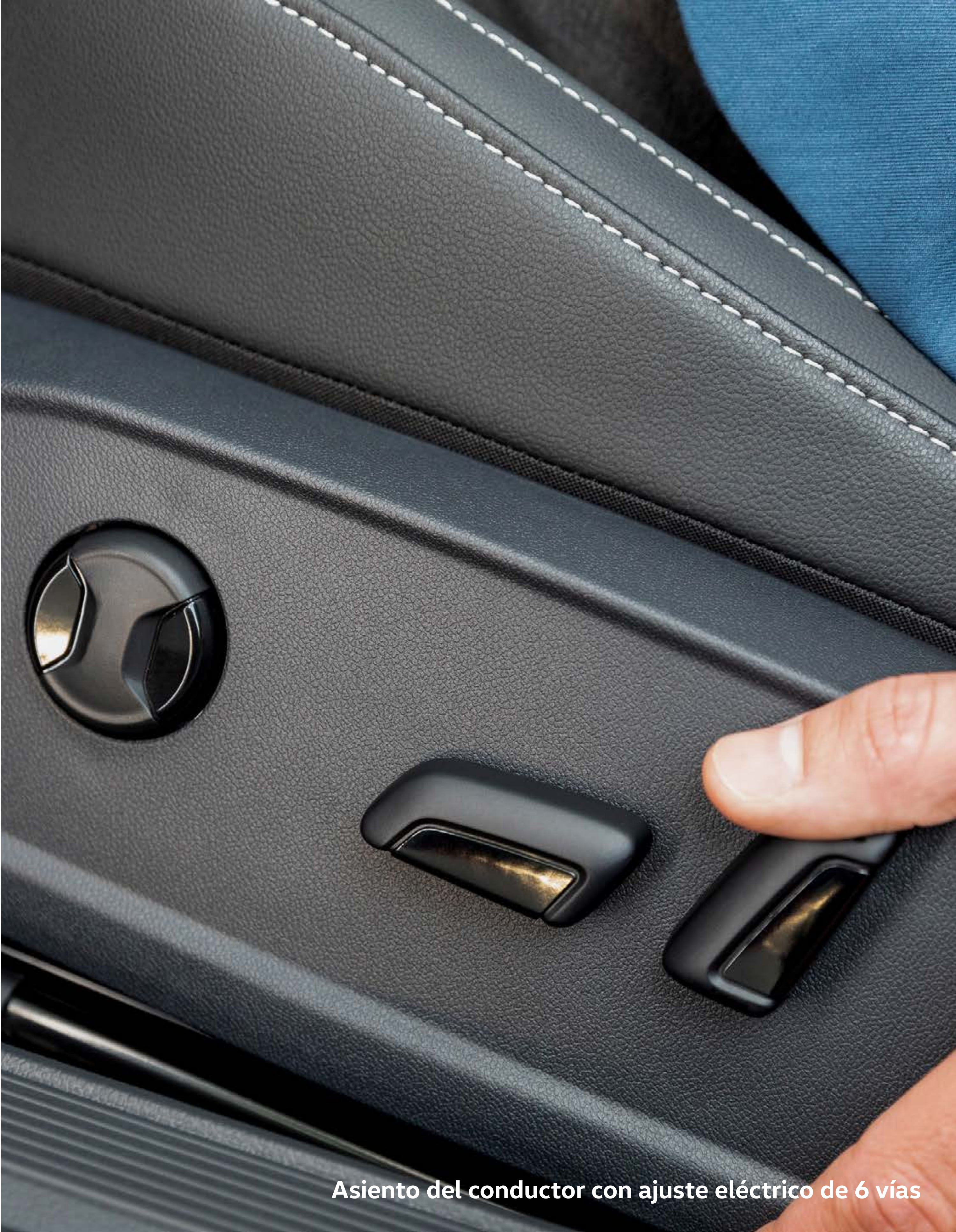
Asiento del conductor con ajuste eléctrico de 6 vías