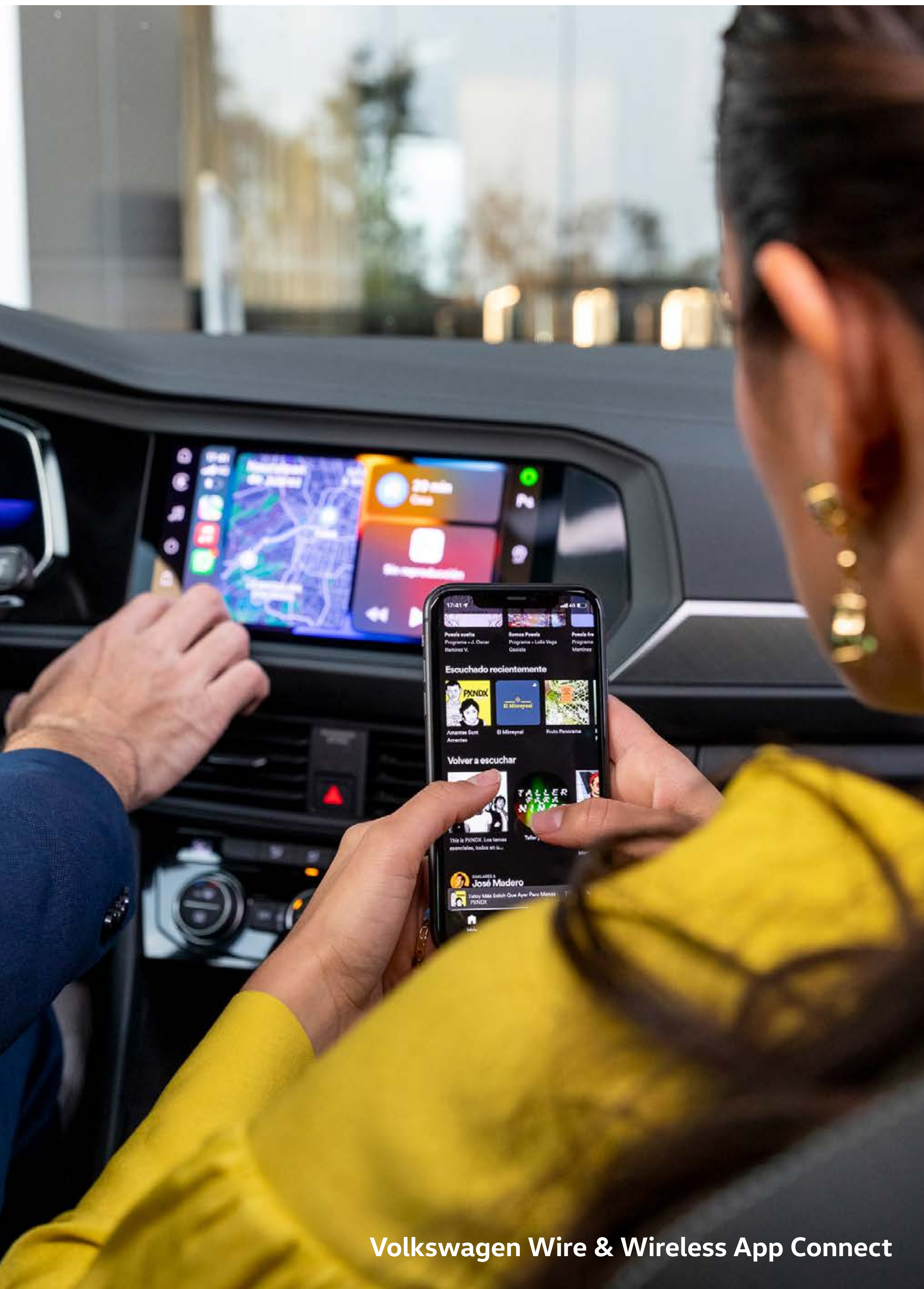
Volkswagen Wire & Wireless App Connect