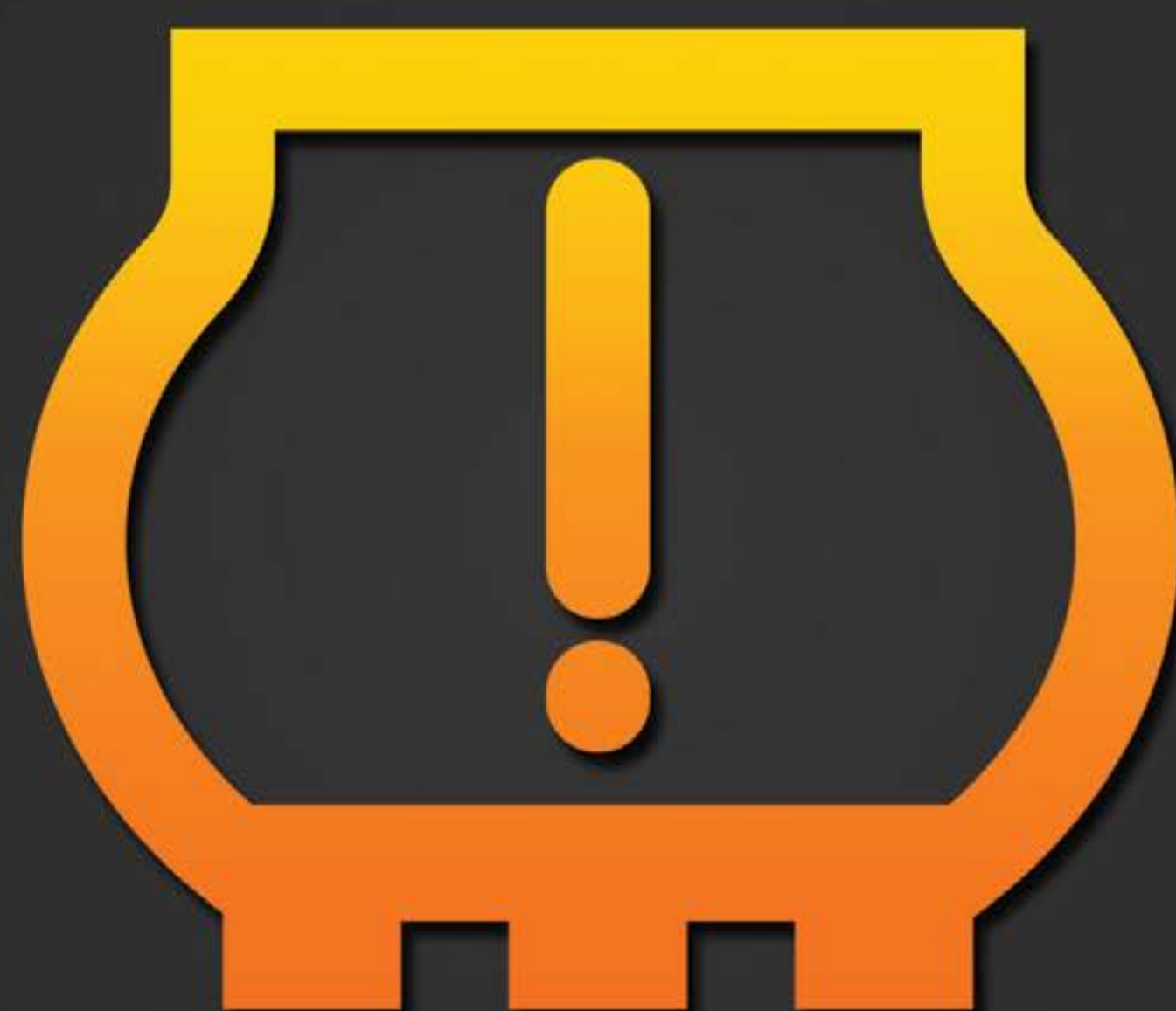
Testigo de pérdida de presión de neumáticos

El testigo de pérdida de presión de neumáticos te notificará con señales ópticas y/o acústicas si la presión es demasiado baja o si hay una pérdida repentina de presión. Como sea, siempre disfrutarás el más alto nivel de seguridad. TL CL SL