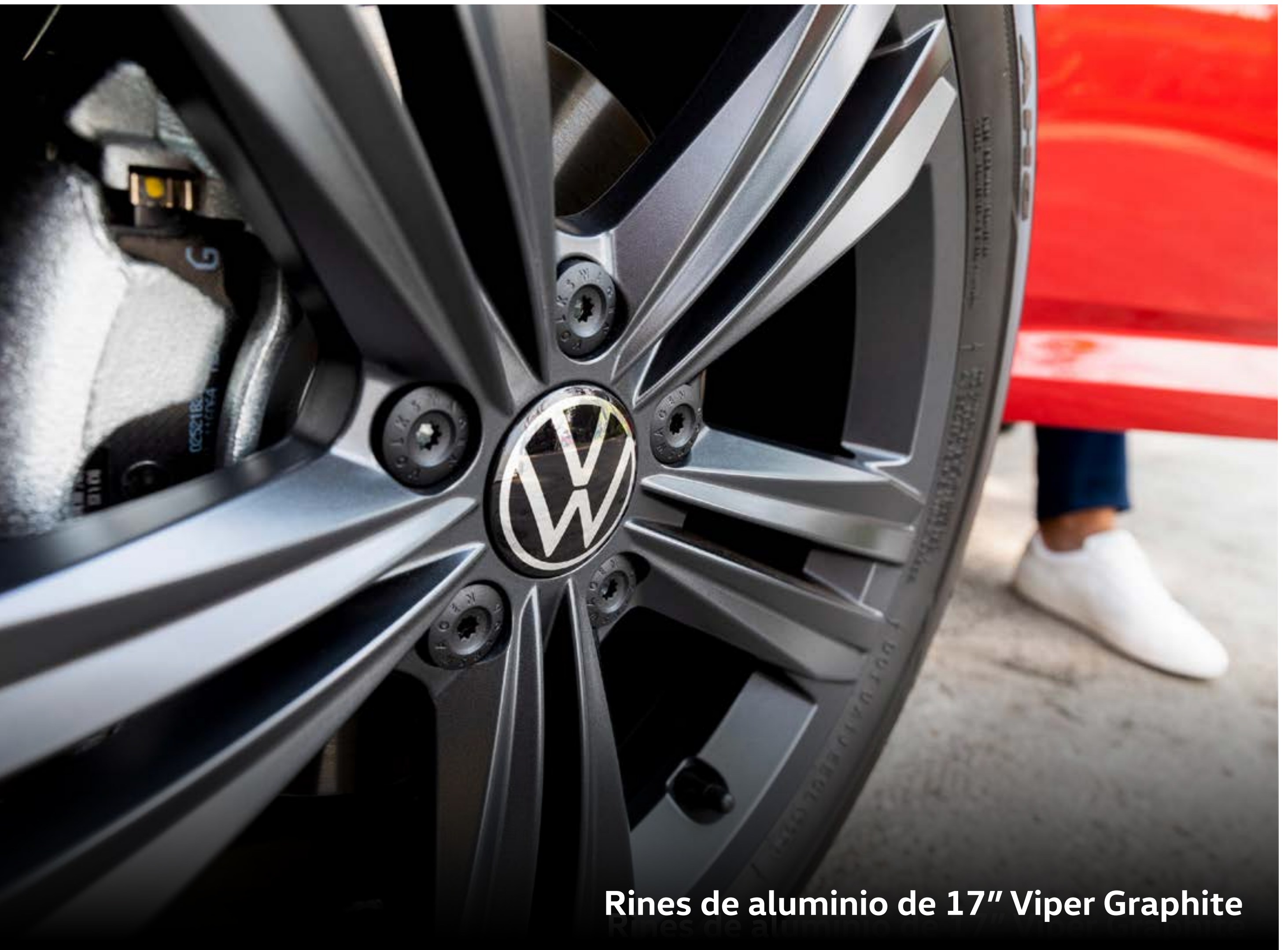
Rines de aluminio de 17" Viper Graphite

Con Jetta 2024 demuestra tu verdadera esencia en cada viaje. Estilo, diseño y cadencia cada vez mejores a bordo de tu siguiente Volkswagen. SL