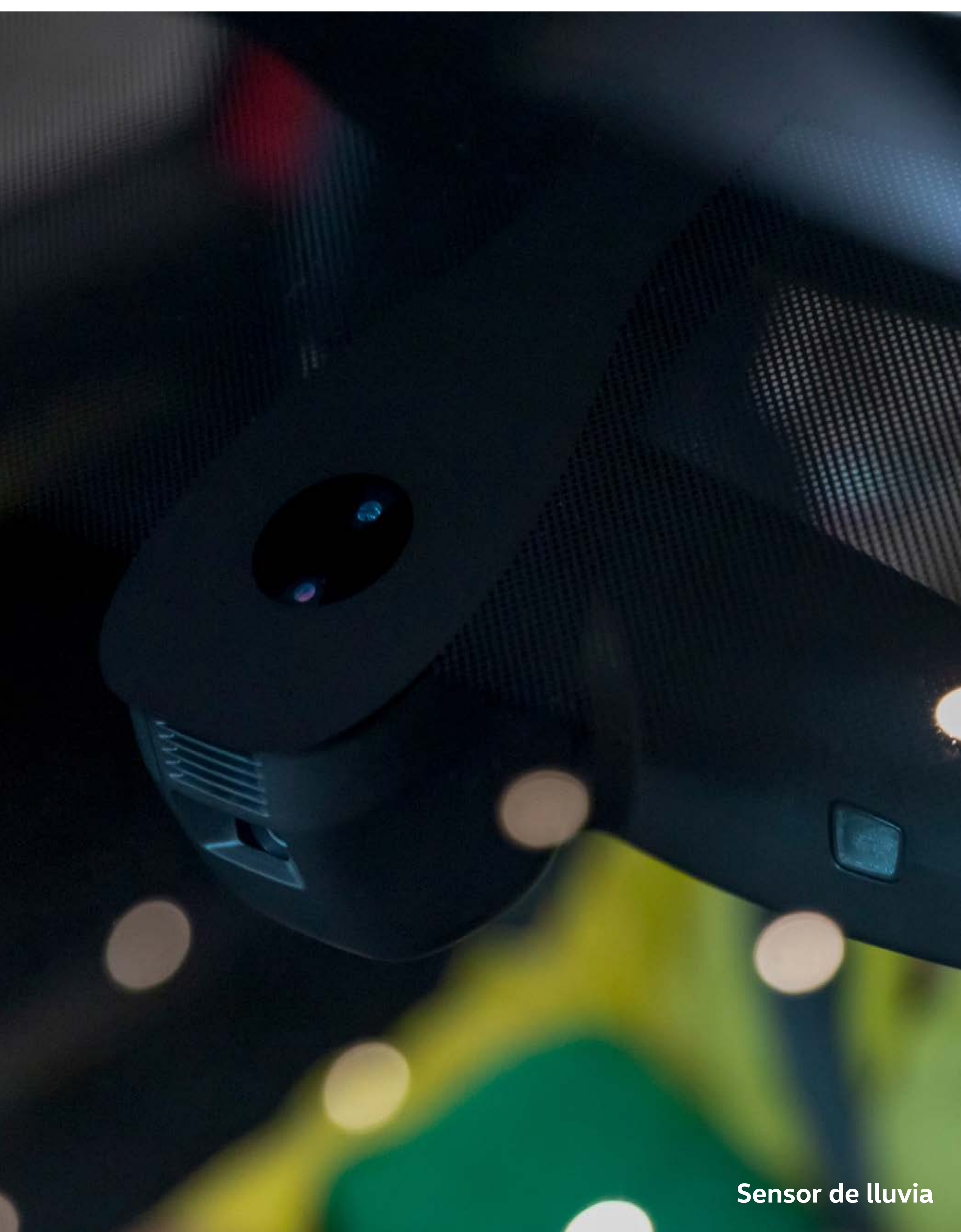
Sensor de lluvia

No habrá clima que empañe tu ascenso porque el sensor de lluvia con regulación automática de los limpiaparabrisas ajusta los barridos del limpiaparabrisas, dependiendo de la intensidad de la lluvia. CL SL