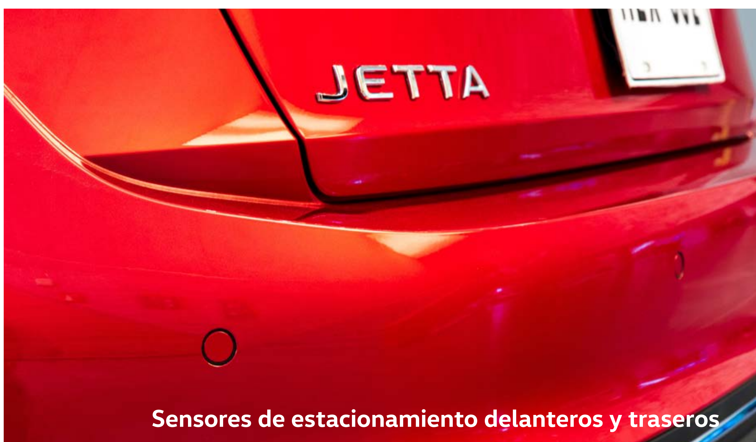
Sensores de estacionamiento delanteros y traseros