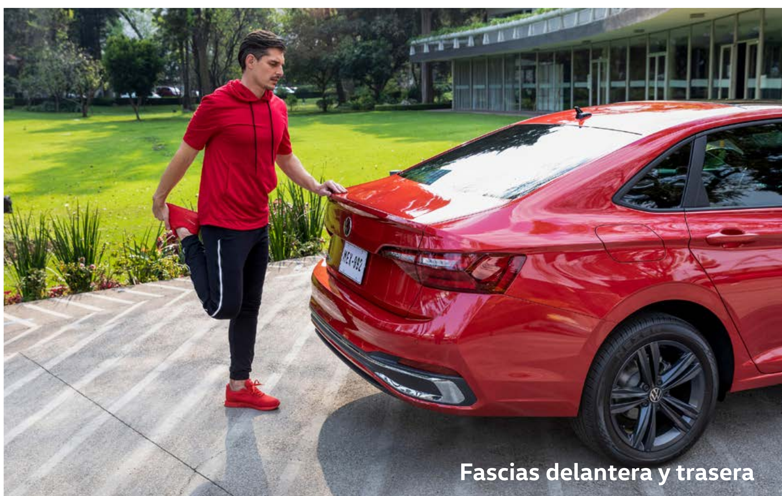
Fascias delantera y trasera